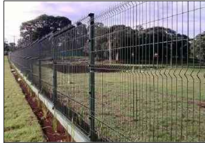
MODELO DO GRADIL