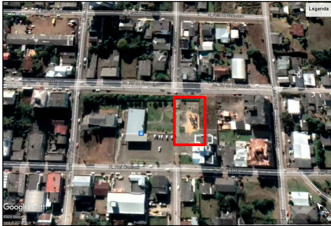
CROQUI DE LOCALIZAÇÃO Sem escala