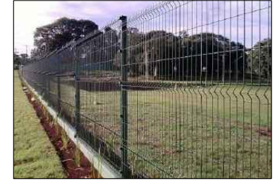
MODELO DO GRADIL

DESCRIÇÃO: Gradil galvanizado com pintura eletrostática; Malha 5x20; Diâmetro 4,3mm Mão de obra inclusa para execução;