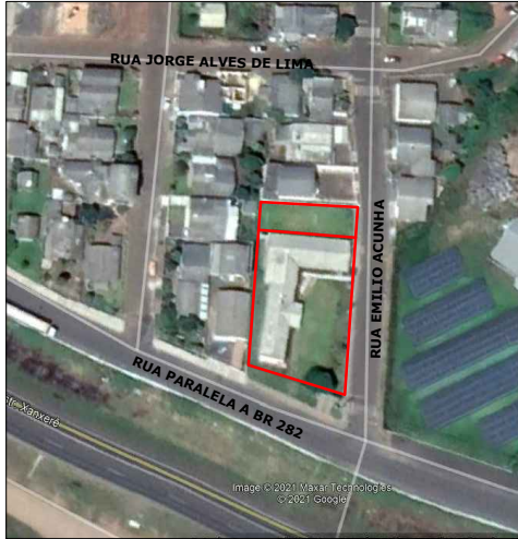
CROQUI DE LOCALIZAÇÃO Sem escala