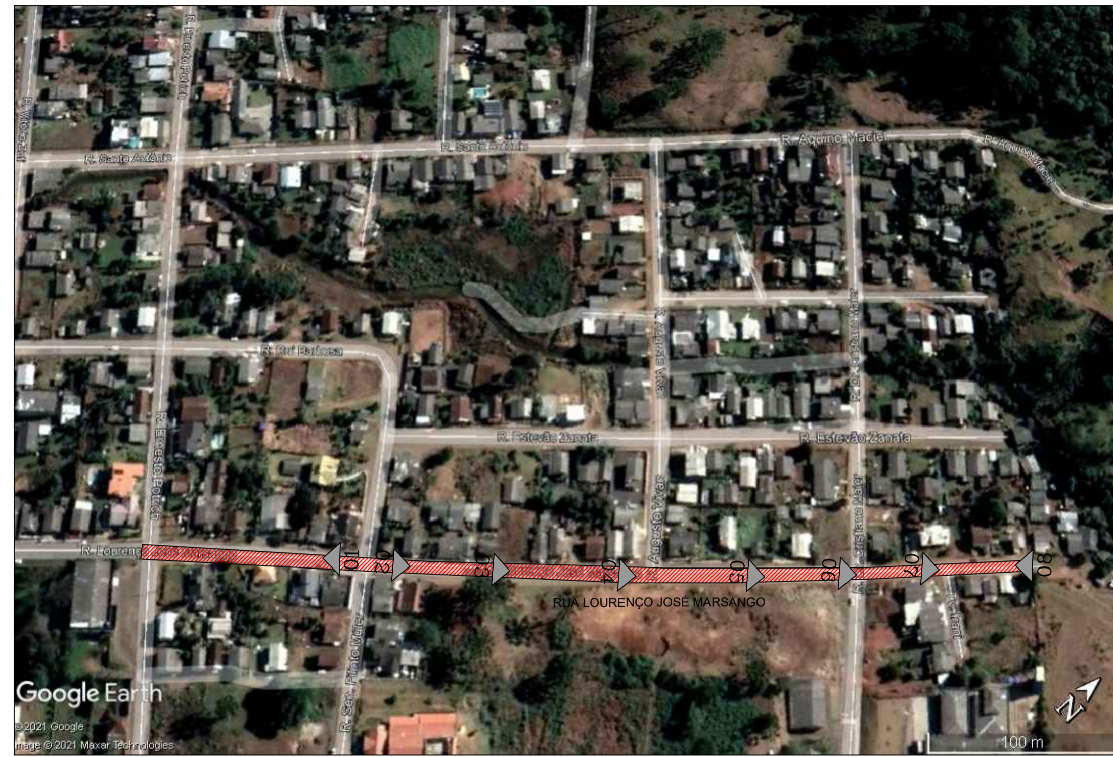
CROQUI DE LOCALIZAÇÃO S/ Escala