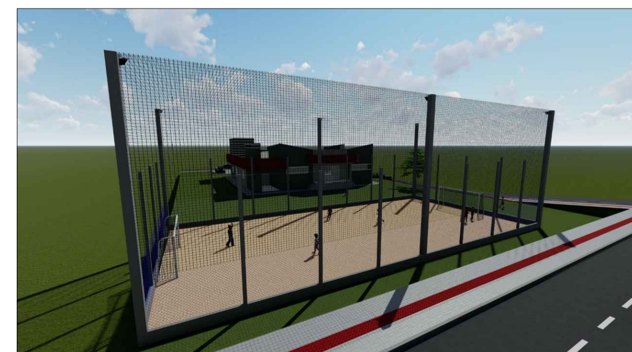
IMAGEM MAQUETE ELETRÔNICA