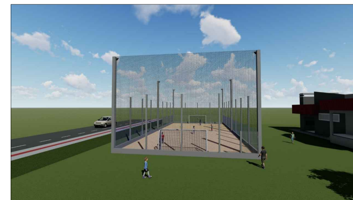
IMAGEM MAQUETE ELETRÔNICA