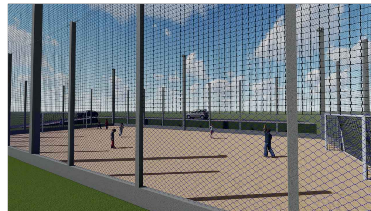
IMAGEM MAQUETE ELETRÔNICA