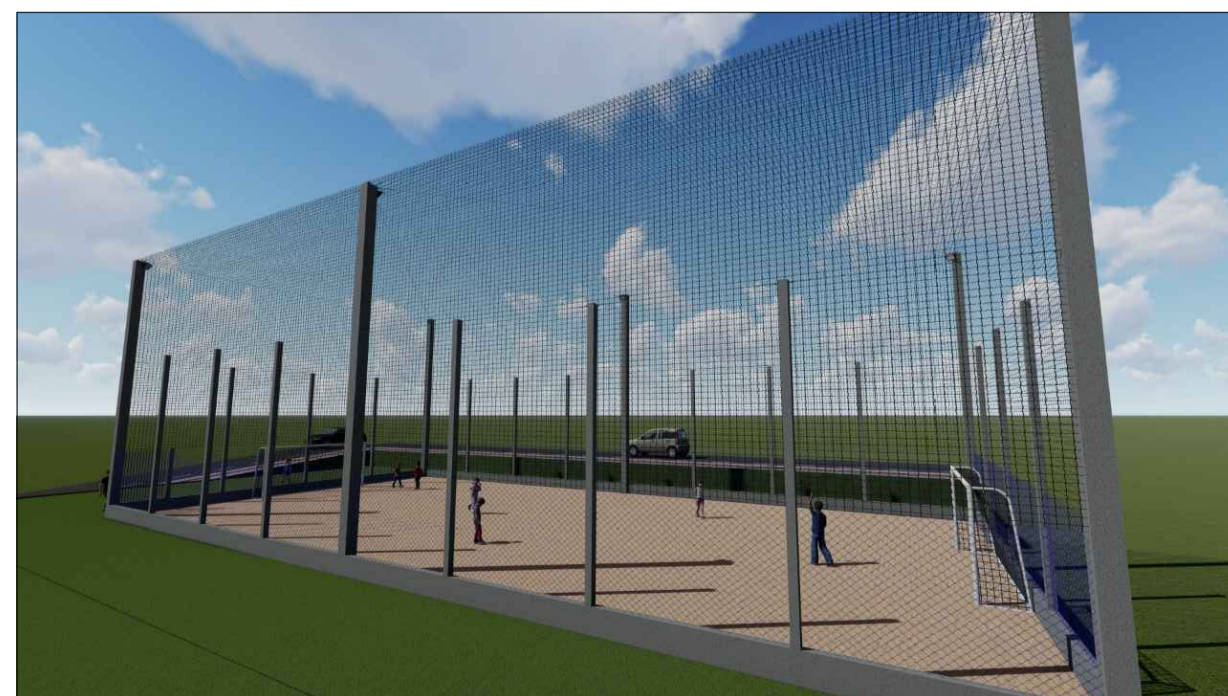
IMAGEM MAQUETE ELETRÔNICA