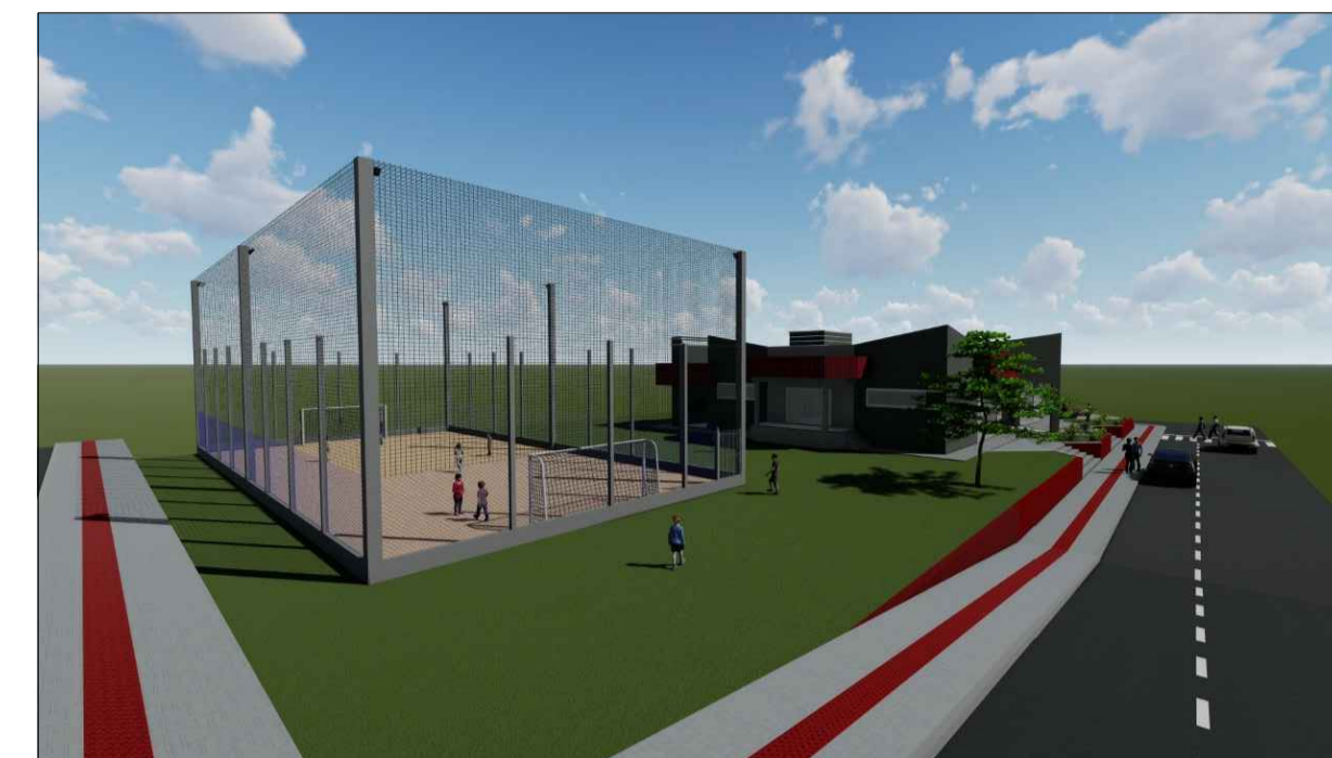
IMAGEM MAQUETE ELETRÔNICA

PLANTA DE COBERTURA ESC.....1/75 A: 297,06m²