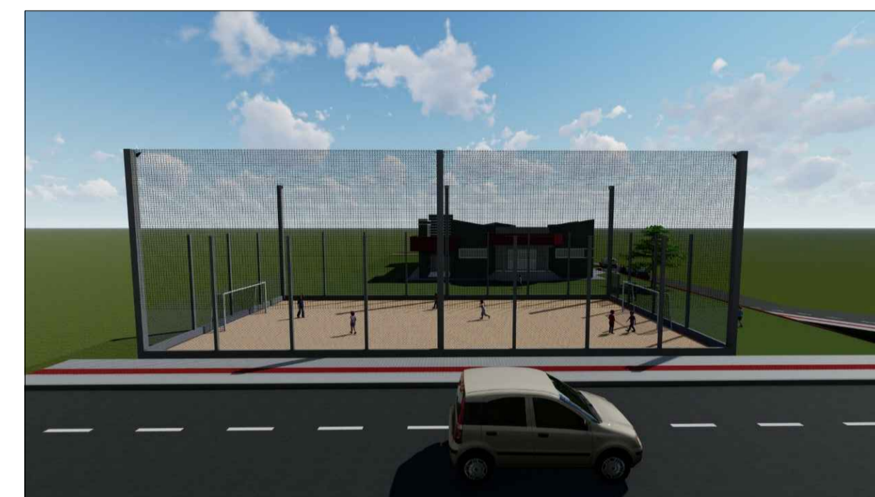
IMAGEM MAQUETE ELETRÔNICA