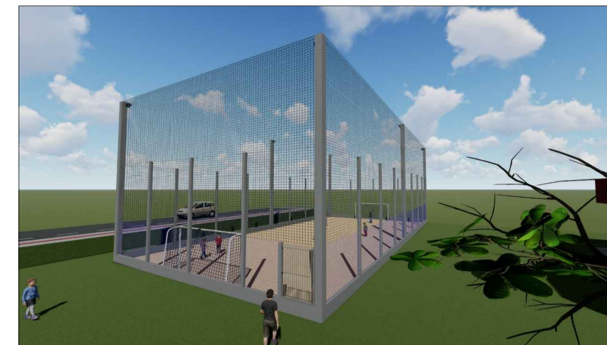
IMAGEM MAQUETE ELETRÔNICA