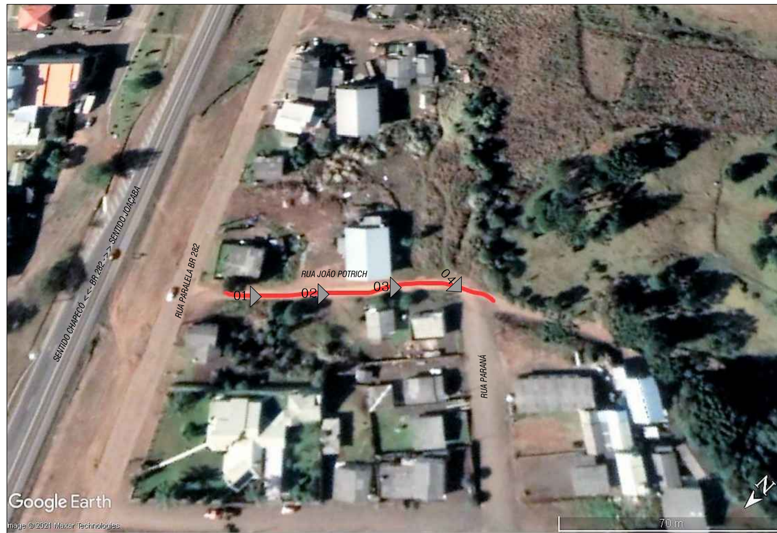
CROQUI DE LOCALIZAÇÃO S/ Escala