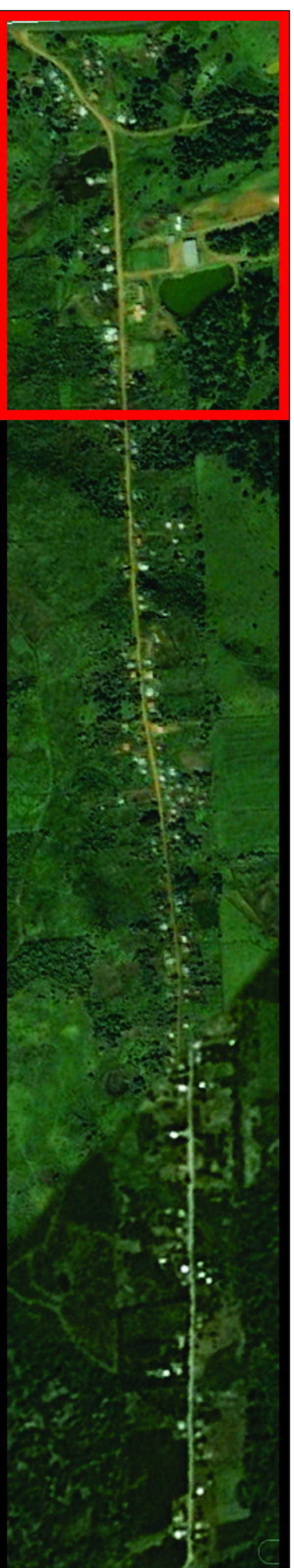
Extensão Vila Pouso dos Tropeiros