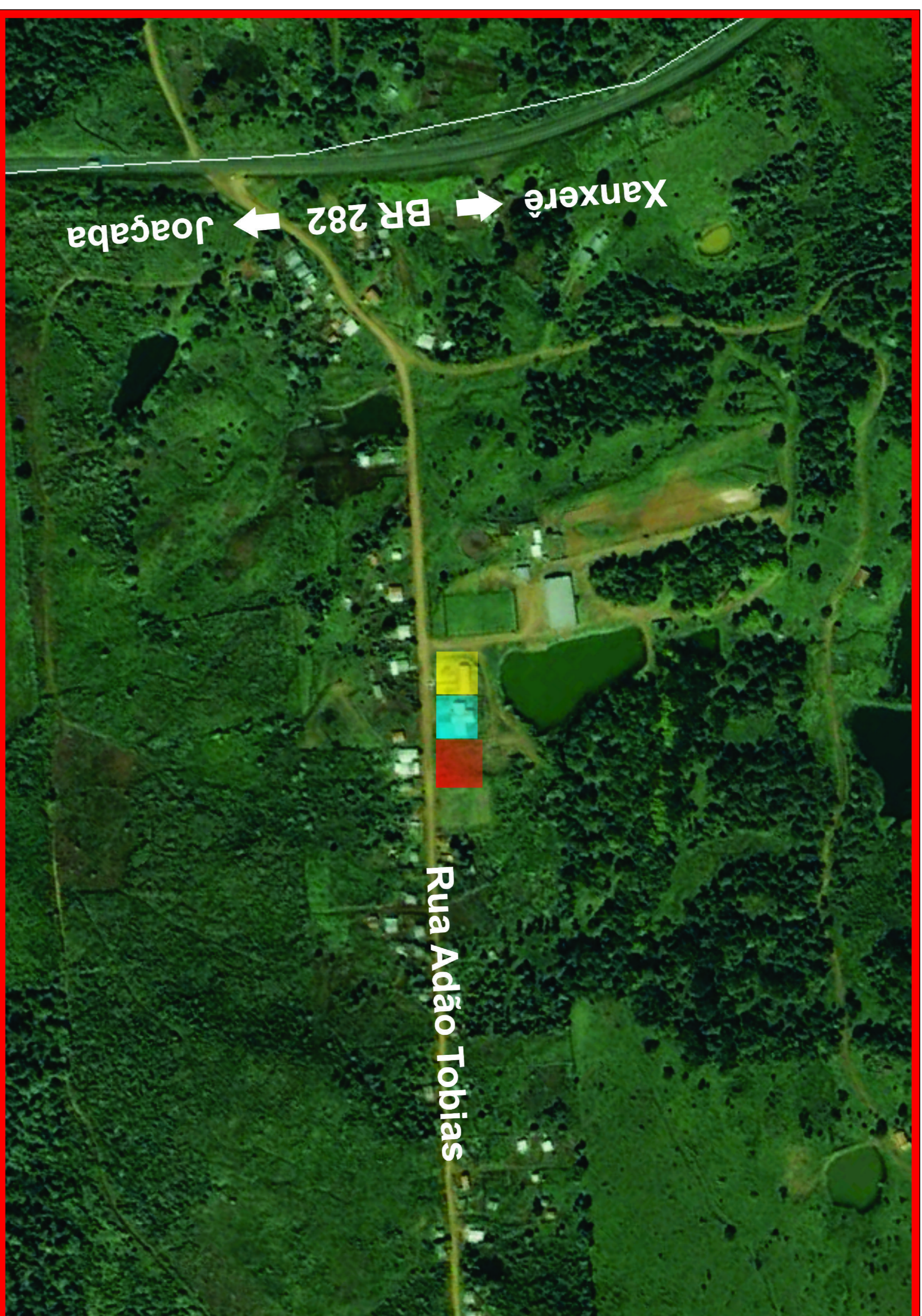
Zoom da Área