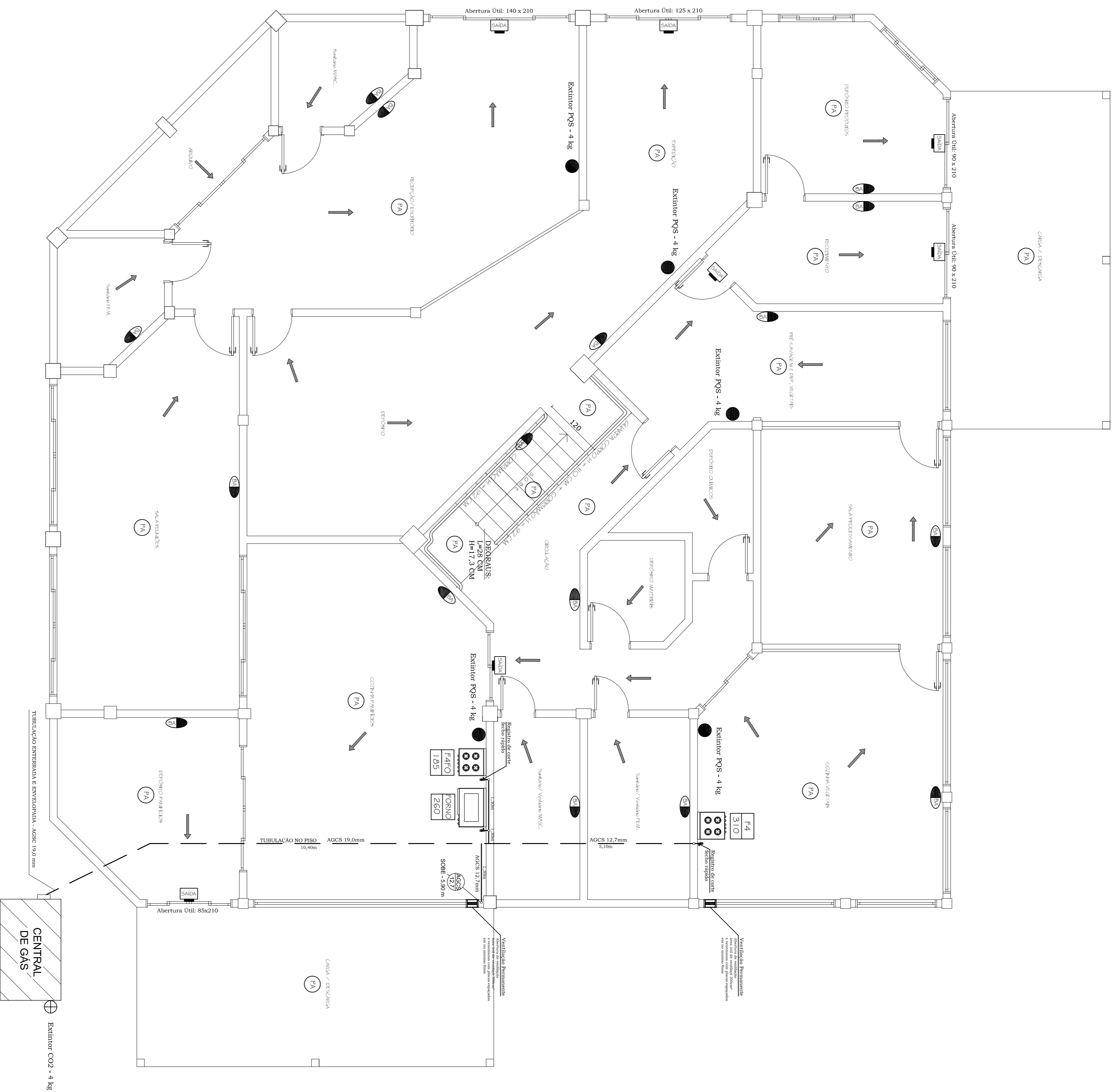
PLANTA BAIXA - Subsolo ESC.: 1:50