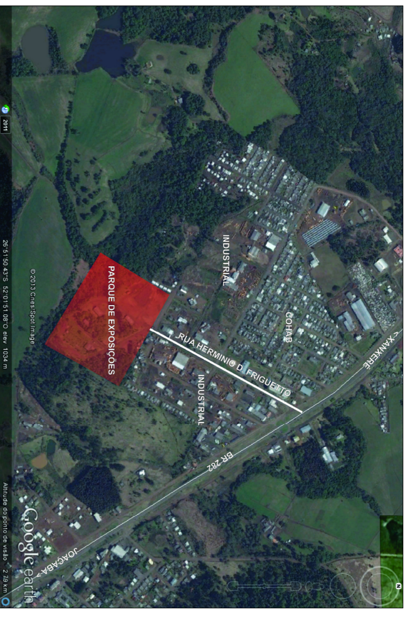
CROQUI DE LOCALIZAÇÃO SEM ESCALA