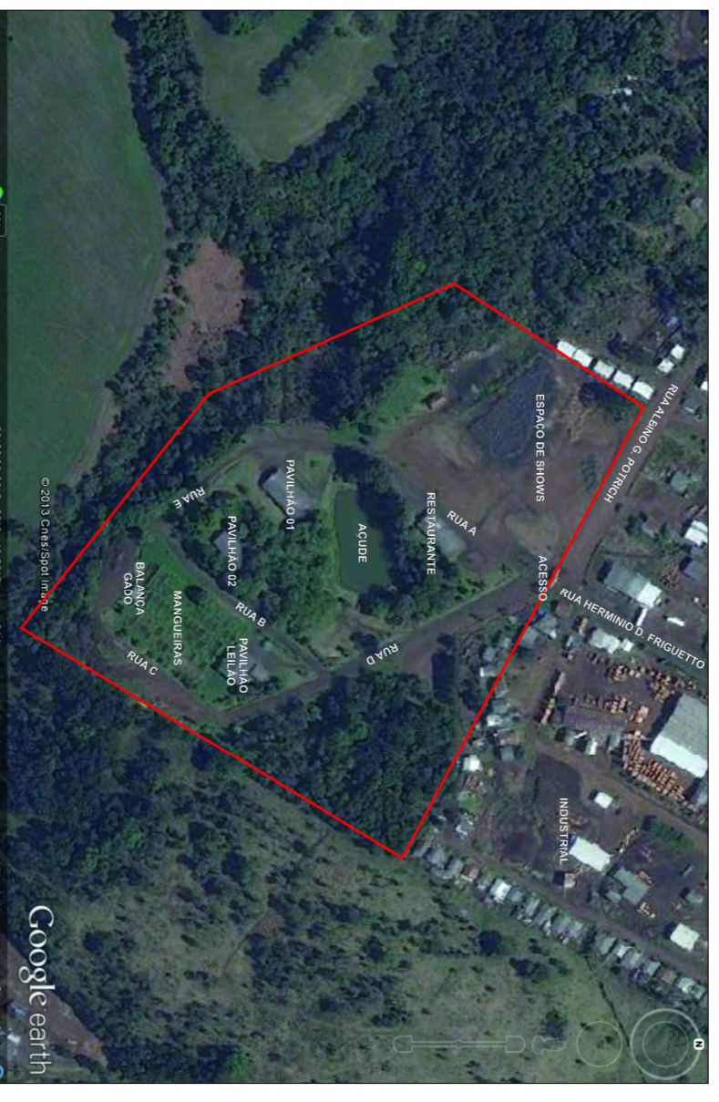
MAPA DE SITUAÇÃO DO PARQUE SEM ESCALA