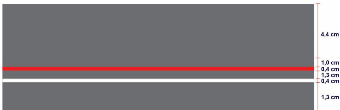
TABELA DE MEDIDAS PARA AS JAQUETAS ESCOLARES