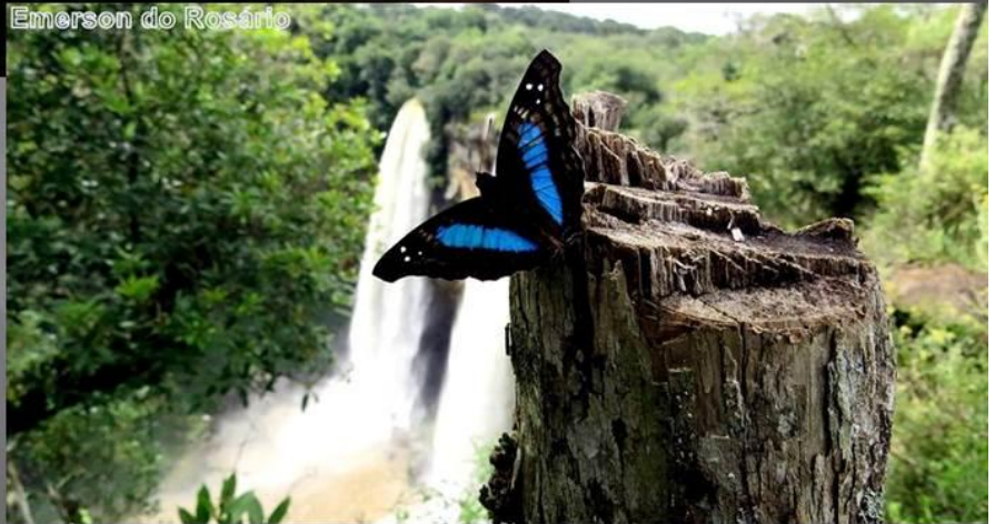
Emerson do Rosário